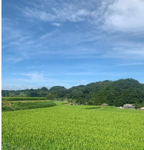
↑ 田んぼの稲もだいぶ成長してきました

屋外で過ごすには危険な暑さが続きましたが、夏休みということもあり、家族連れの様も多かった印象。川遊びなど、夏らしい楽しみ方のお問い合わせも。