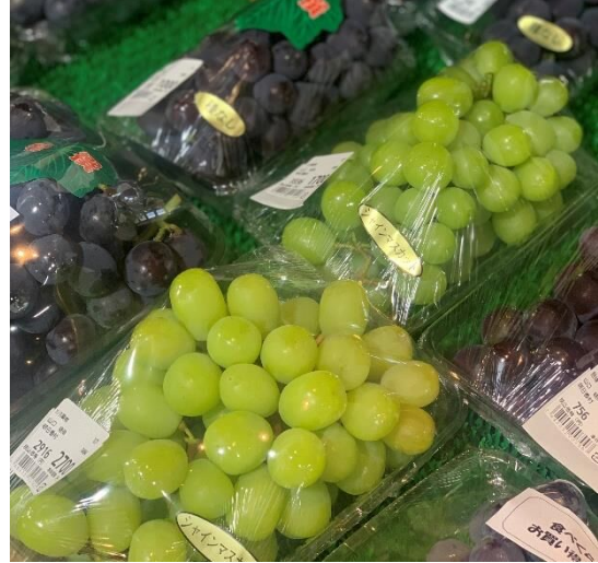
↑ 飛鳥駅前の夢販売所では、旬の葡萄がずらっと並んでいます