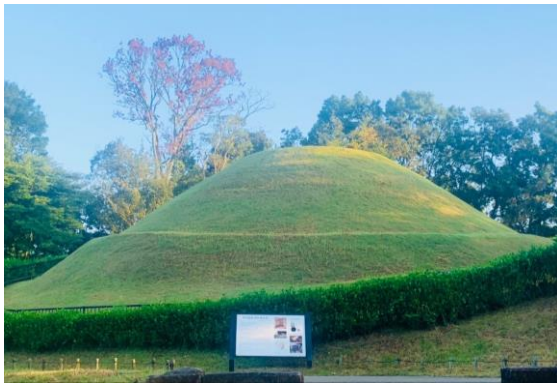
↑高松塚古墳も青々とした爽やかな姿です

新緑美しい散策日和、ゴールデンウィークを中心に多くの来村がありました。また、遠足シーズンということもあり、いつもよりも多く、ワイワイ楽しそうな子どもたちの姿を村内各所で見かけた月でした。