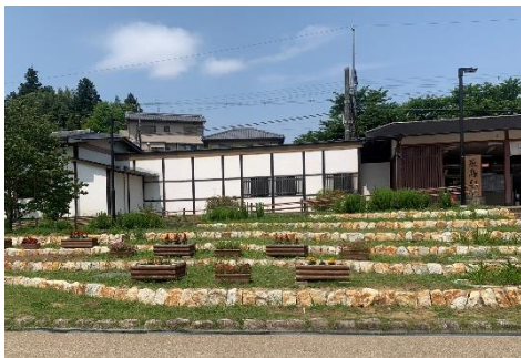
↑駅前の植栽ボランティアでは、駅前花壇の除草作業に参加しました。

案内所での来館は、国内はもちろん、海外の方の来館がぐっと増え、英語で案内する機会も増加。団体で来村のケースも多い印象。