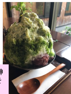
奈良といえばかき氷。村内の神籬さん。この夏最後のかき氷をいただきました♡