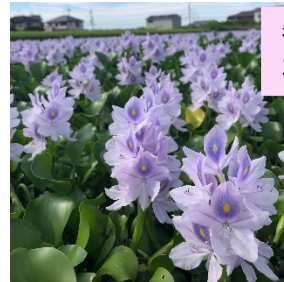
観光協会に問合せがあった本薬師寺のホテアオイ