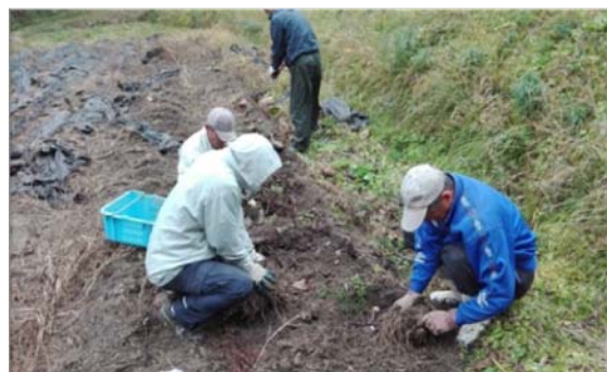
里芋の収穫をする、島庄集落営農組合の方たち