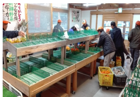
販売所に自作のみかんを並べる農家さんたち