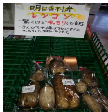
野菜のおいしさをシンプルにアピール