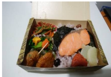
3月から始まる「あすか夢弁当」

見た目ではわかりづらい、野菜や果物のおいしさを アピールするため、POPづくりや売り場での声だし・声か けを日常的に行うようにし、売れ残りがなくなるように工 夫しました。