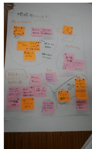
研修では、地域おこしの あり方について考えました。