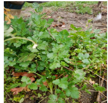
春には珍しいパクチー