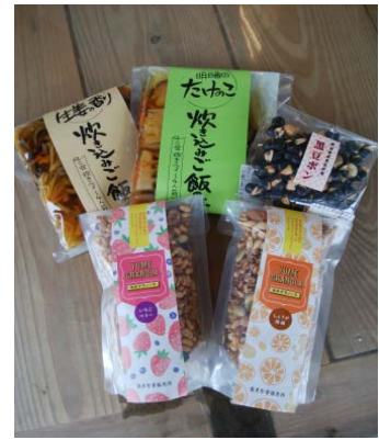
加工部の人気商品

・ 販売所での販売促進 見た目ではわかりづらい、野菜や果物のおいしさをアピールするため、POPづくりや売り場での声だし・声かけを日常的に行うようにし、売れ残りがなくなるように工夫しました。