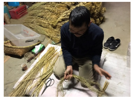
基本の藁を縛る練習