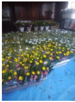
年末用に大量につくられた仏花