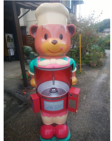
くまさんの綿菓子機