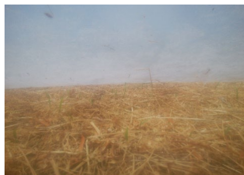
小さい緑の芽が出始めました