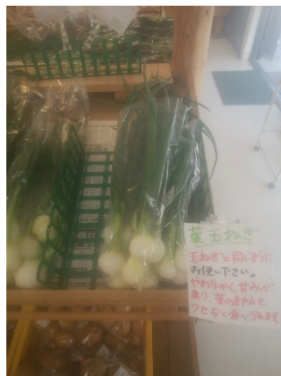
葉玉ねぎをシンプルに