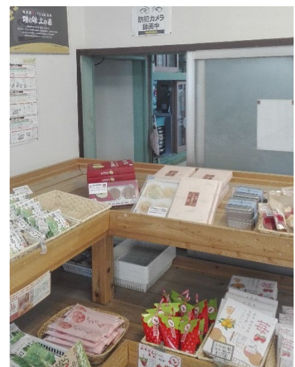
風通しもよく、防犯対策にも