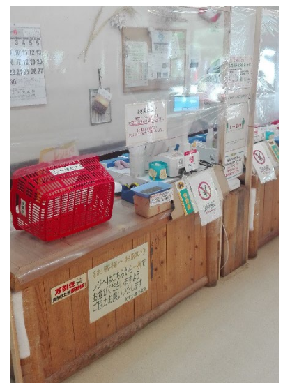
コロナ対策の一環