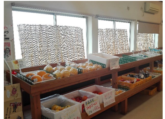
外の簾を外し、明るくなった店内

料理の仕方がわかりづらくて売れ残りがちな野菜には、使いやすさを簡単に伝えるPOPをつくり、売れ残りがないよう工夫しました。