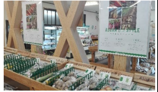
明日香ビオスタイルコーナー

6月1日から、無農薬有機栽培などの野菜・米・加工品をそろえた「明日香ビオスタイルコーナー」ができました。毎週金曜日の明日香ビオマルシェの出展者たちなどの農産物が毎日購入できるということで、喜ばれています。広めていくために、Instagramで頻りに商品の品揃えをアップし、注目してもらえるようにしています。