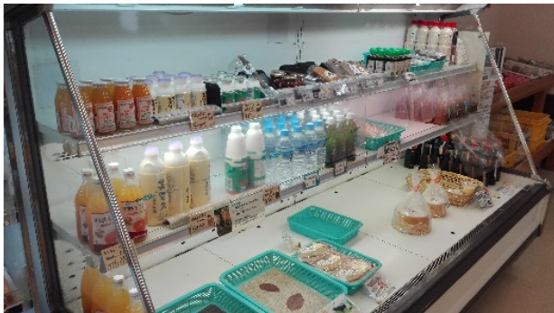
整理されて温度も下がった冷蔵庫

他には、気温の上昇とともに冷蔵庫の温度が上がってしまう、というトラブルがあったので、清掃・棚の整理などをして処置をしたり、「壁が汚くて薄暗い」印象だったトイレをそうじし、改善しました。