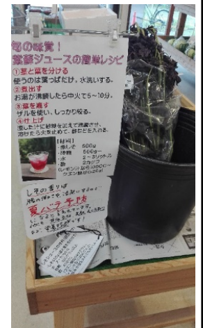
しそジュースのレシピもつけておすすめ