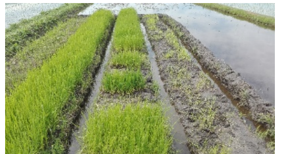
元気に成長した稲の苗