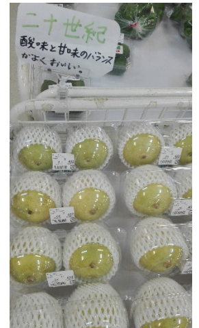
酸味と甘味のある 二十世紀の梨