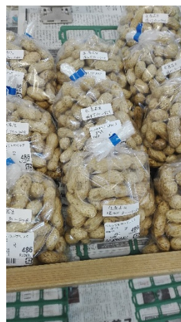
無農薬落花生を インスタグラムにアップ