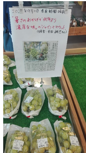
新聞にも掲載された シャインマスカット

無農薬野菜の明日香ビオスタイルコーナーについてはインスタグラムを更新して情報発信をしました。