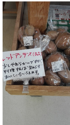
理由を書いておけばB品でも買ってくれる