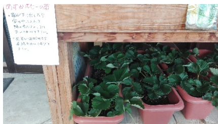
冬はプランターごと家の中に入れてあげると育ちやすい

いちご農家さんがつくったあすかルビーの苗は、お客さんの反応がとてもよく、栽培の仕方についてよく聞かれたので、説明書きをして、より多くの方に知ってもらえるようにしました。