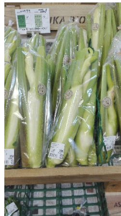
秋しかとれないマコモダケ