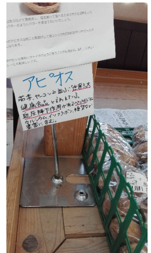
アピオスは健康へのよきアピール