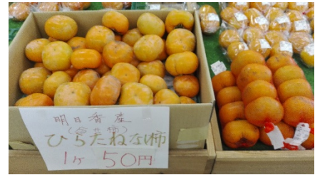
柿はバラ売りだと買いやすい

柿は、今年は虫食いなどで表面があまりきれいではないものが多いようでした。味は確かなのですがお客さんは買いづらいようなので、その旨をPOPでお客さんに伝え、さらにバラ売りして買いやすくなるように工夫しました。