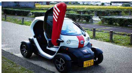
* Michimo お客様の関心大です