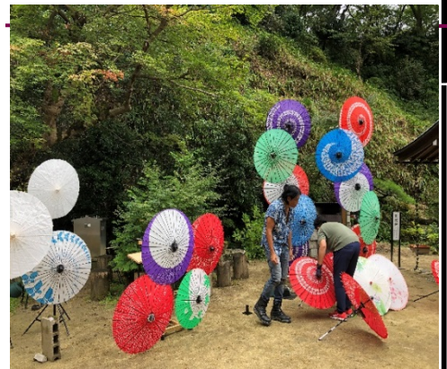
光の回廊準備(岡寺)

先月より本格参加している村猟友会の活動(毎週水・土曜日に 定期活動)、設置檻のメンテナンスと罟の設置による獣害駆除の対策。実際の捕獲 に至るまで各大字くまなく茂みに入って、現場での地道な動物との関わり方に取り組 んでいます。