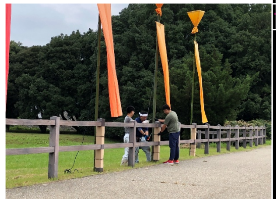
光の回廊準備(川原大字)