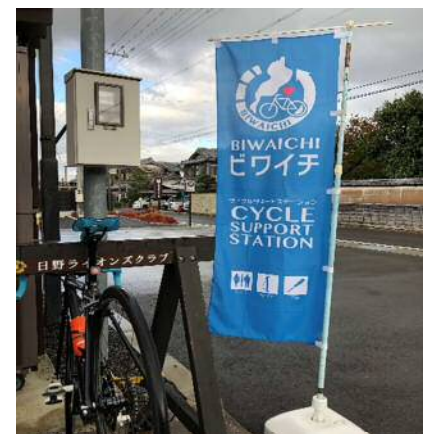
ビワイチサイクルステーション(日野町)