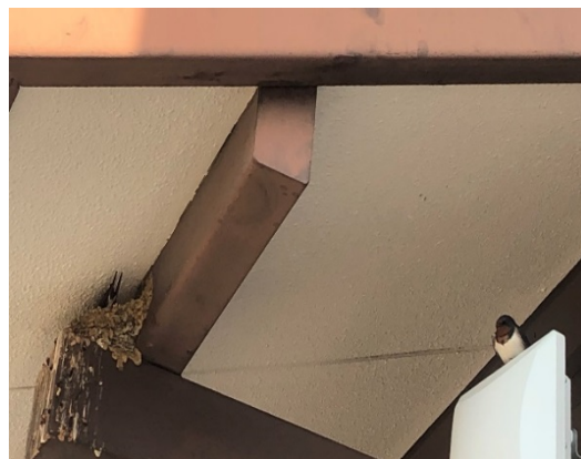
引き続きツバメです、つがいが仲良くしてます