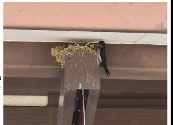
(ツバメ～観光案内所)